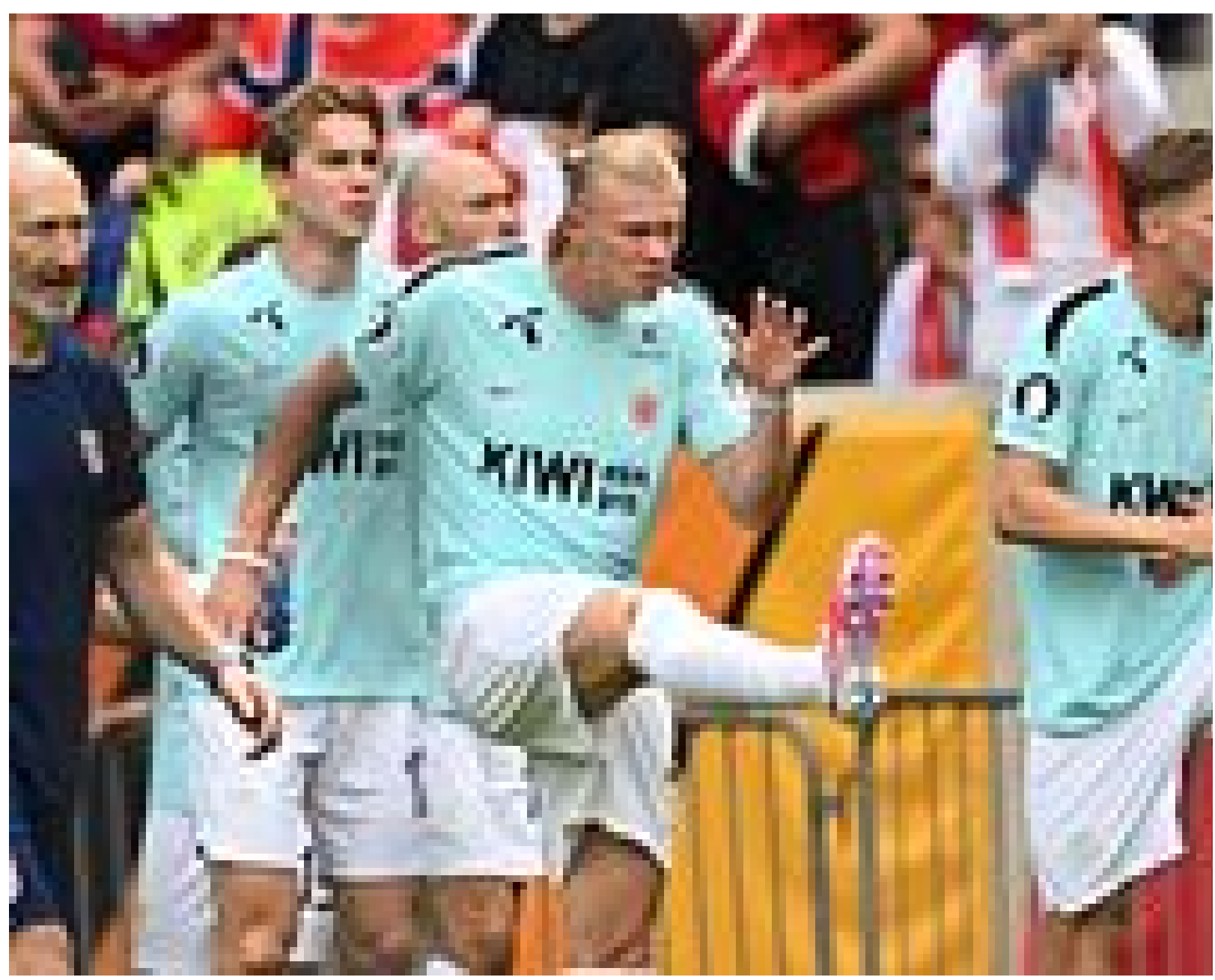
Møtt med pipekonsert